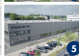
Service-Gebäude Füllenkamp 9

Stieglmeyer GmbH & Co. KG Ackerstraße 42, 32051 Herford Telefon: +49 (0) 5221 185 - 0 Fax: +49 (0) 5221 185 - 252 E-Mail: info@stieglmeyer.com www.stieglmeyer.com