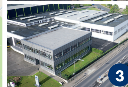
Werk 3 Ackerstraße 37