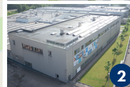
Werk 2 Füllenbruchstraße 82