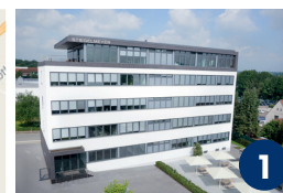
Hauptverwaltung Ackerstraße 42