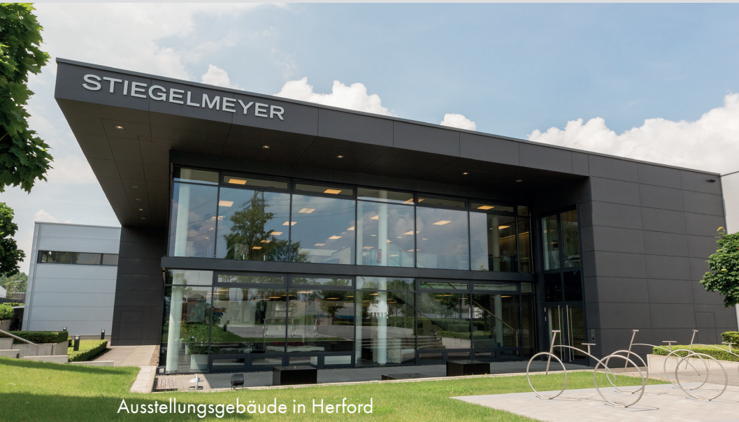
Ausstellungsgebäude in Herford